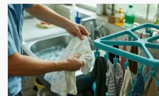
下着と布製品の除菌