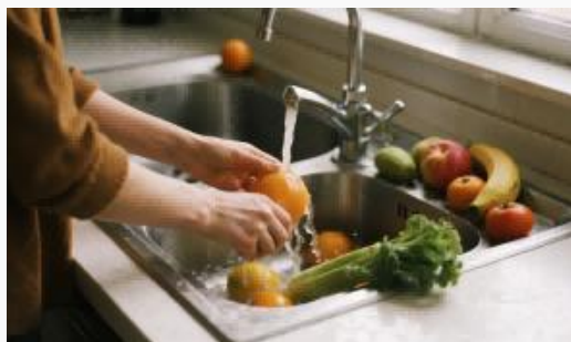
果物、野菜、食器の洗浄