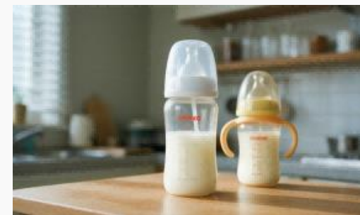
哺乳瓶の消臭・殺菌