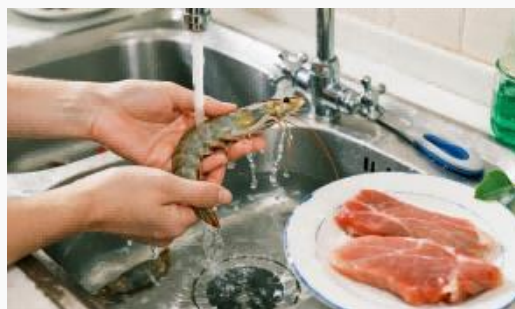
魚介類と肉の処理