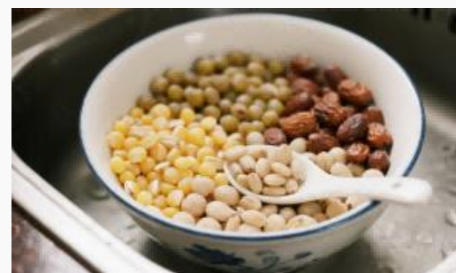
穀物と豆類の洗浄（卵と細菌の除去）