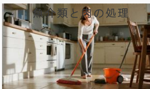
家庭内の表面消毒