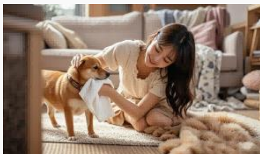
ペットの臭いを消す